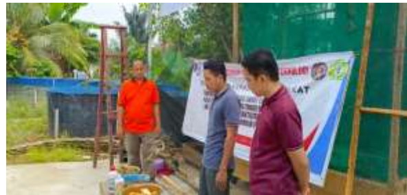
Gambar 1 . Pemasangan Alat IoT Smart Farming

Secara keseluruhan, implementasi sistem Smart Farming berbasis IoT menunjukkan bahwa digitalisasi pertanian merupakan langkah strategis dalam meningkatkan produktivitas dan efisiensi kelompok tani, khususnya dalam menghadapi tantangan perubahan iklim dan keterbatasan sumber daya.