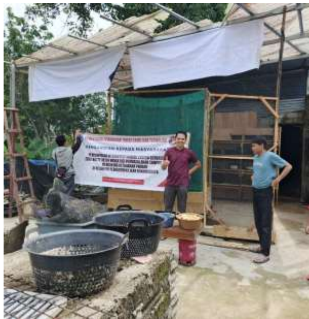
Gambar 2. Sosialisasi Penggunaan Alat IoT